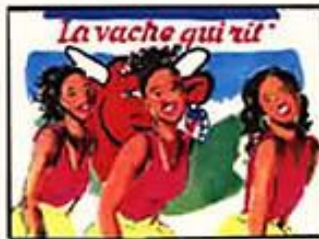
Chœur : "Parce que vache qui rit !"