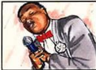
Crooner ringard : "Pourquoi m'as-tu quitté, pourquoi..."