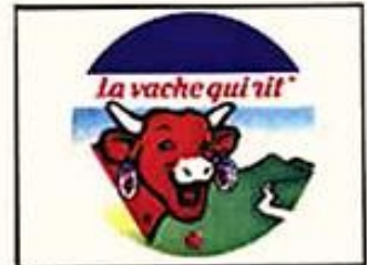
(SFX : Rire façon Salvador)