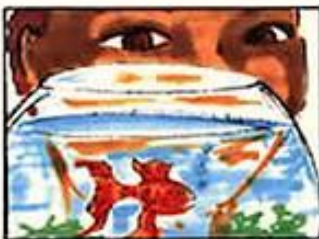
Enfant : "Pourquoi ils sont rouges les poissons rouges"